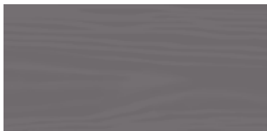
Brown Grey 109