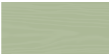
Pale Green 131