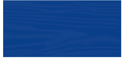
Sky Blue 142