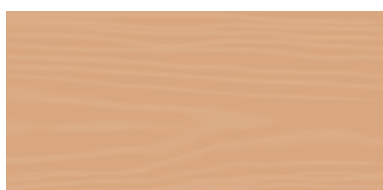
Brown Beige 112