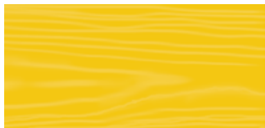
Lemon Yellow 119