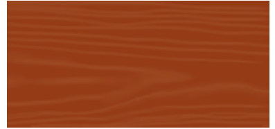
Cherry (pearwood) 16