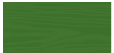
Grass Green 134