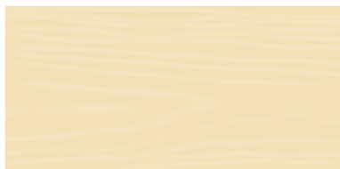
Natural Wood 08