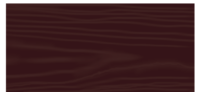
Dark Walnut 63