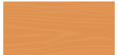
Light Cherry 29