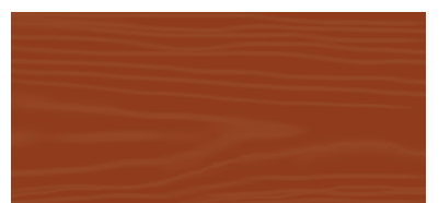
Cherry (pearwood) 16