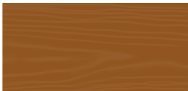
Dark Elm 13