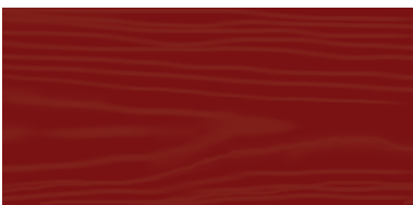
Red Brown 124