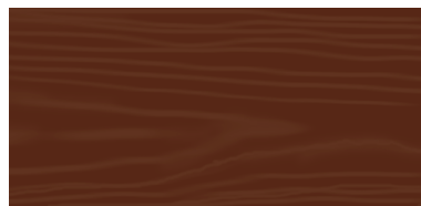
Medium Walnut 59